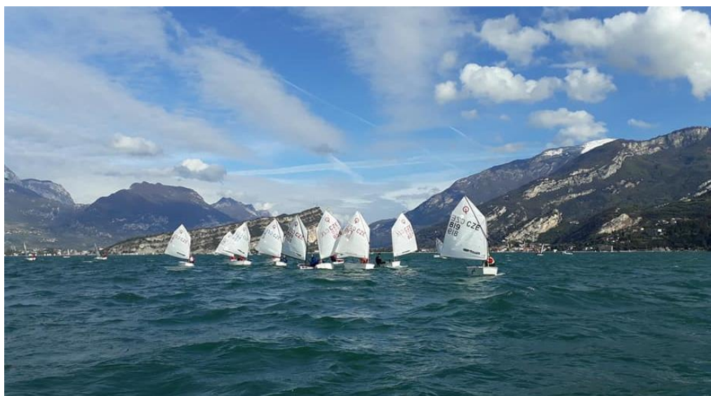
Trénink na Gardě