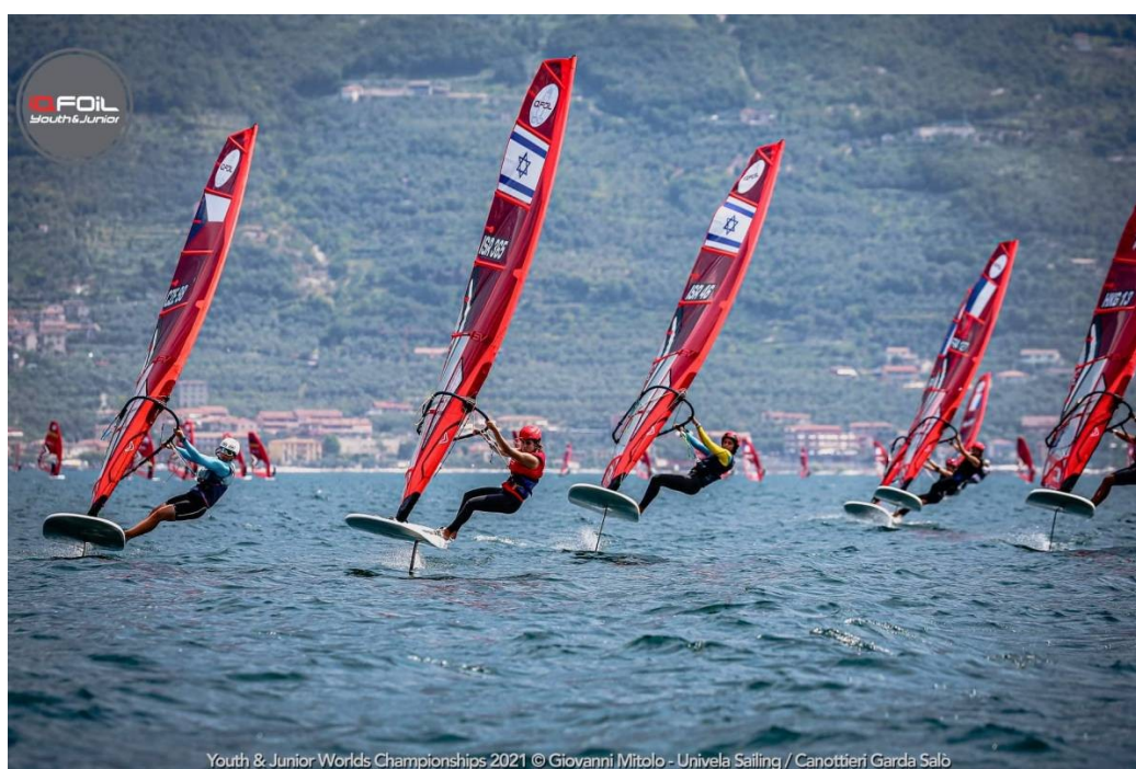
Youth & Junior Worlds Championships 2021

Po závodě jsme začali okamžitě trénovat na iQFoilu a připravovat se na nadcházející MS juniorů v této třídě.