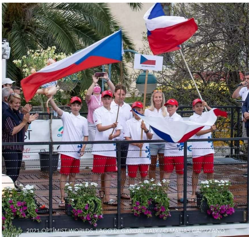
2021 OPTIMIST WORLDS, LAGO DI GARDA, ITALY