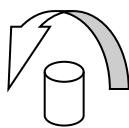
Značka 1 – červená (velká)